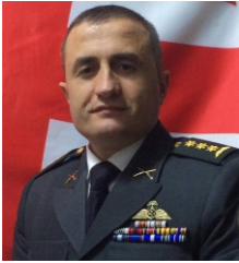
რეჟისორი პოლკოვნიკი მალხაზ მახარაძე