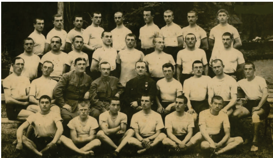
პურსანდთა ჯგუფი 1935 / GROUP OF CADETS 1935

სულ 1938-1992 წლებში სასწავლებელმა განახორციელა 154 გამოშვება, ხოლო გერმანია-საბჭოთა კავშირის ომის დროს თითოეულ წელს - 3 გამოშვება.