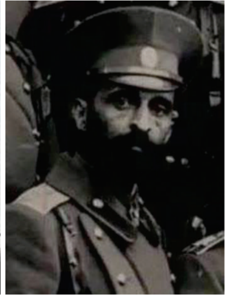
კოლოკონიკი ალექსანდრე ჩხეიძე COLONEL ALEKSANDRE CHKHEIDZE 1921