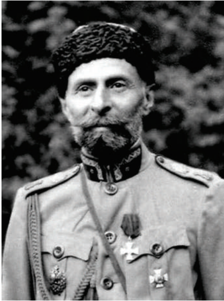
გენერალ-მაიორი გიორგი კვინიტაძე GENERAL MAJOR GIORGI KVINITADZE 1919 - 1920