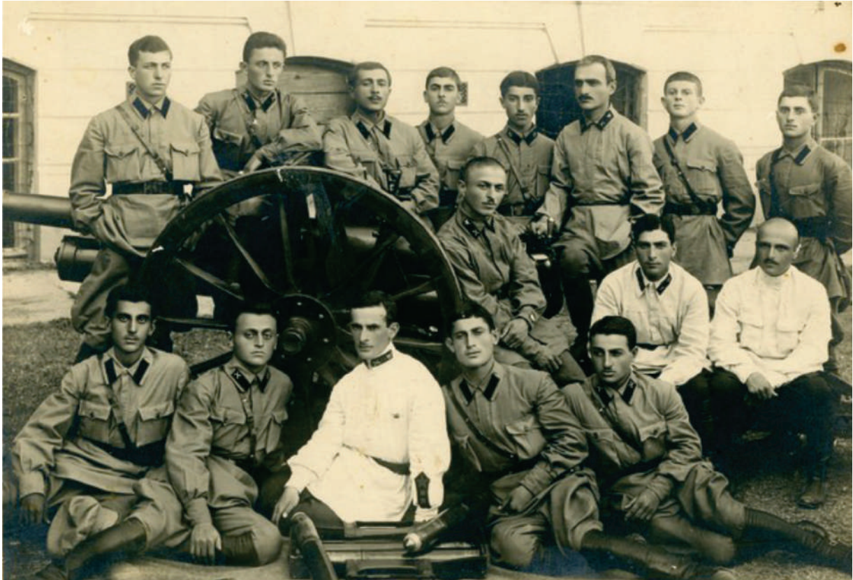
კურსანდობის ჯგუფი 1927 / GROUP OF CADETS 1927